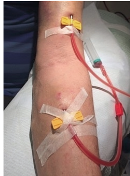
Sådan anvendes en fistel til dialyse